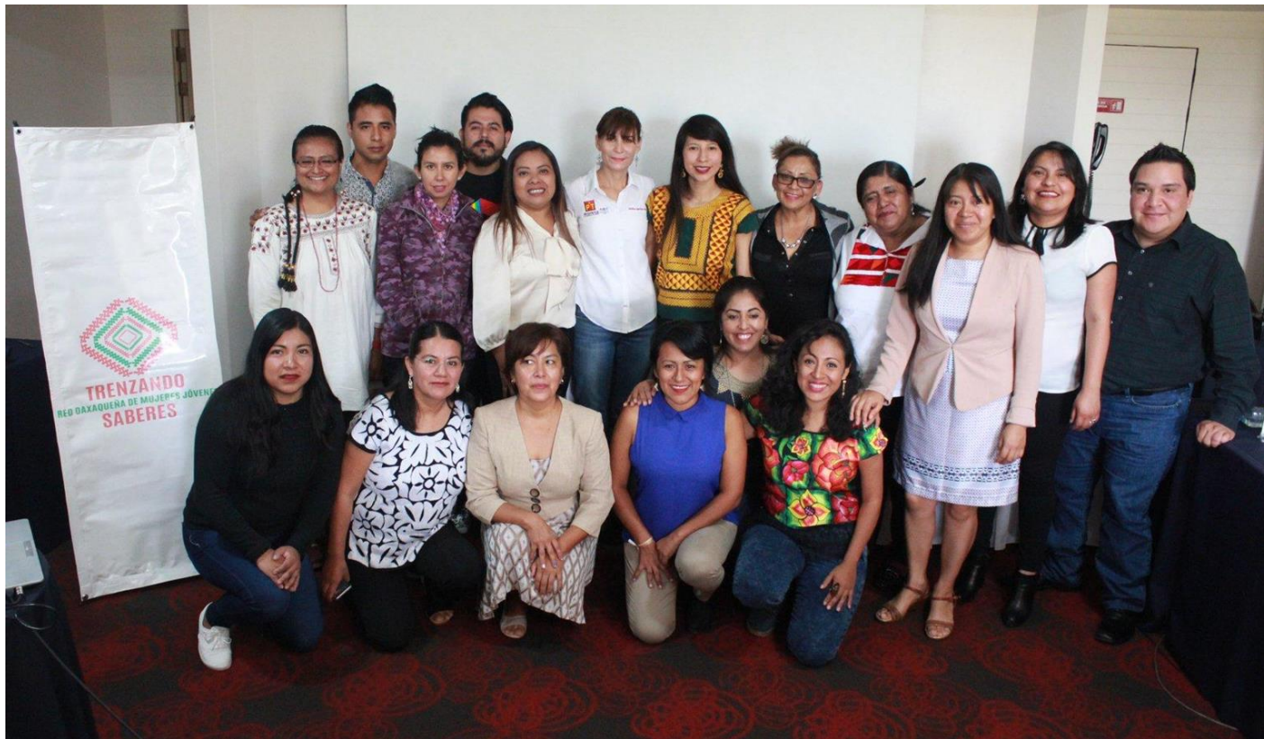
Presentación de demandas en materia de salud sexual y reproductiva de mujeres jóvenes indígenas hacia candidatas a diputaciones locales y federales en el estado de Oaxaca y firma de documento compromiso. Oaxaca, junio de 2018