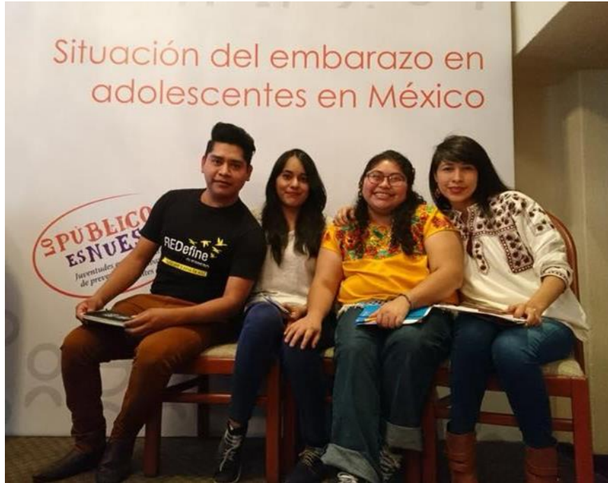
Rueda de prensa sobre hallazgos generales. CDMX, noviembre de 2017 Participan redes de PROMUI y REDEFINE