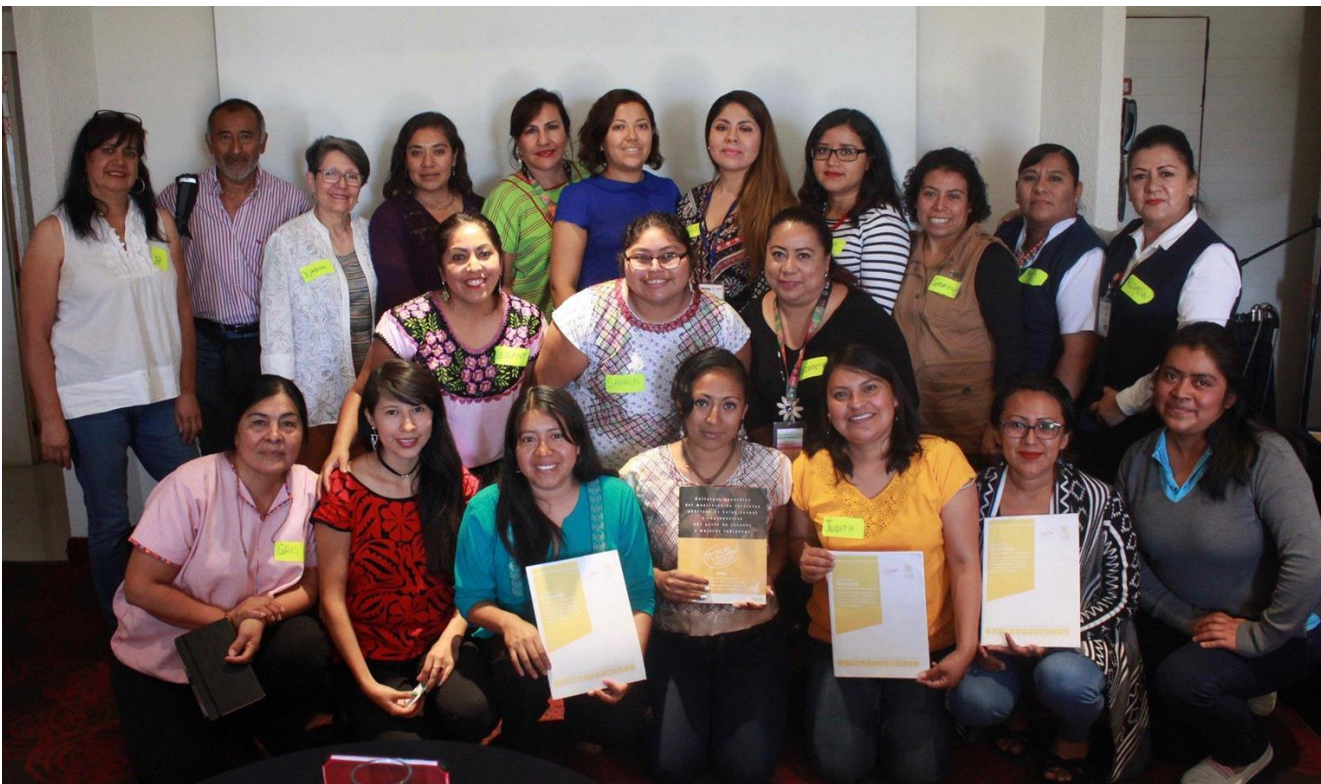
Presentación de hallazgos y documento diagnóstico en el Estado de Oaxaca con Instituciones, servidores públicos y organizaciones de sociedad civil, incluidos: Servicios de Salud de Oaxaca, Secretaría de la Mujer Oaxaqueña, DIGEPO entre otros. Oaxaca, Abril 2018.