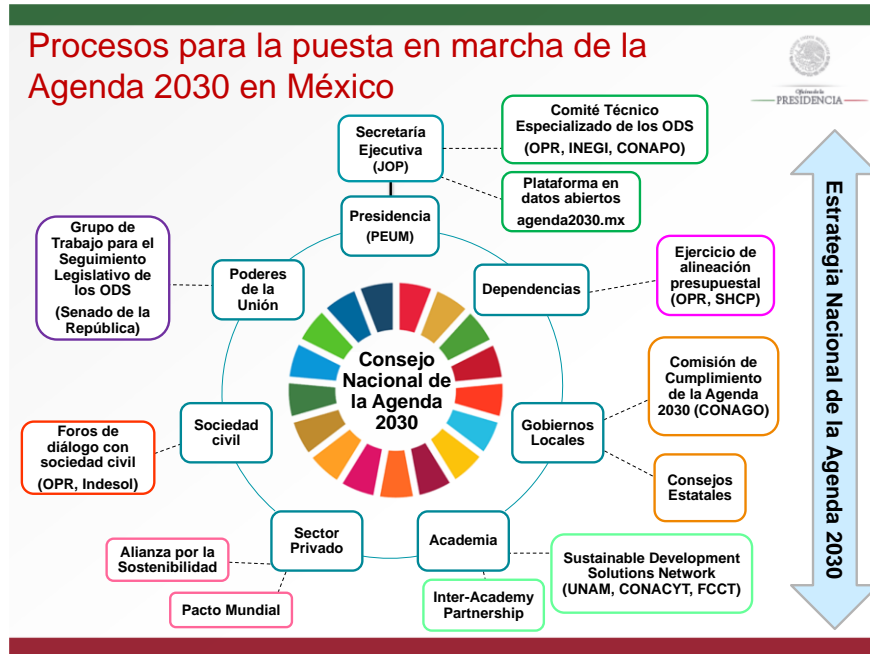
Gráfico 6: Articulación de actores en México para la implementación de la Agenda 2030

La creación del Consejo Nacional de la Agenda 2030, estableció los mecanismos interinstitucionales para alinear la visión de país desde los ODS. Las instituciones y órganos que apoyan la implementación de la Agenda 2030 en México se visualizan en el siguiente gráfico: