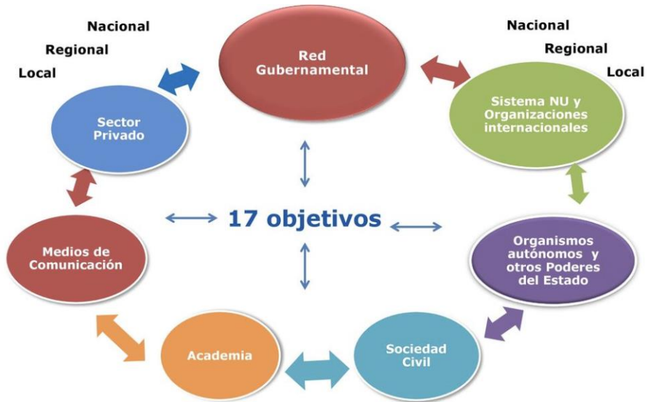
Grafico 4: mapa de actores para la implementación de la Agenda 2030