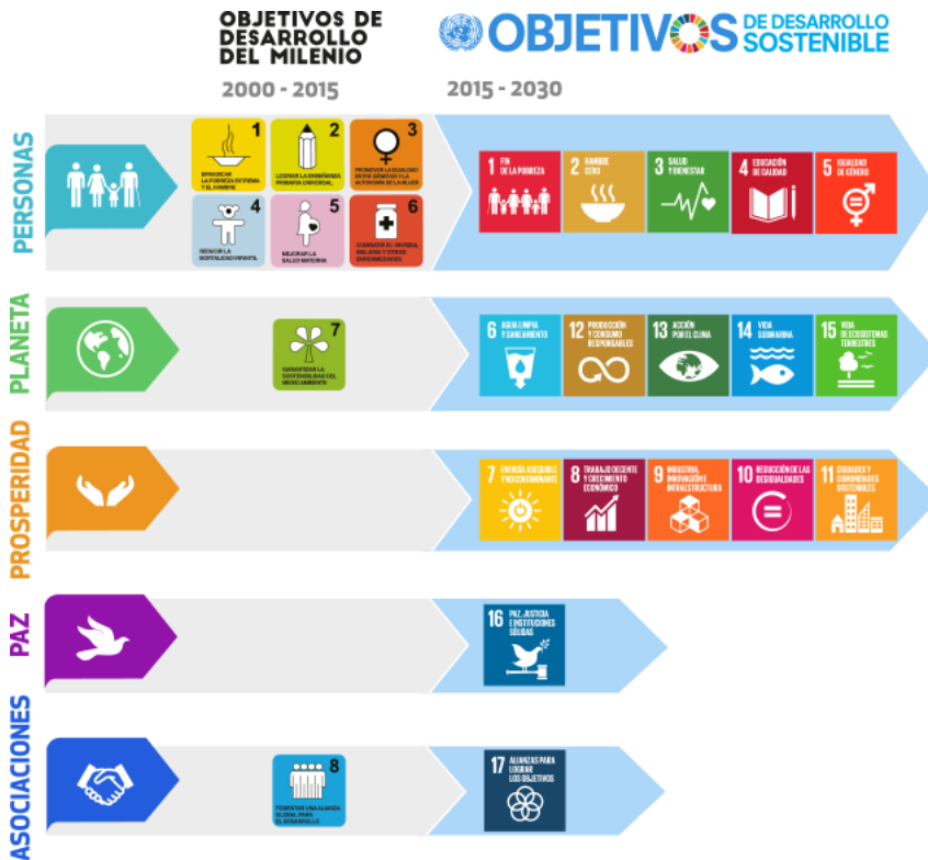
Figura 3: ODM vs ODS